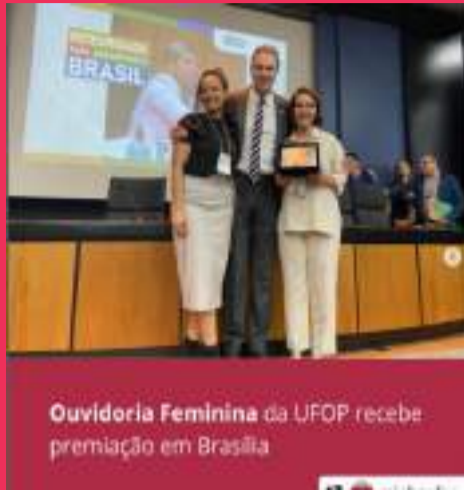
Ouvidoria Feminina da UFOP recebe premiação em Brasília