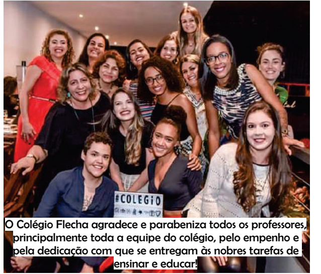
O Colégio Flecha agradece e parabeniza todos os professores, principalmente toda a equipe do colégio, pelo empenho e pela dedicação com que se entregam às nobres tarefas de ensinar e educar!