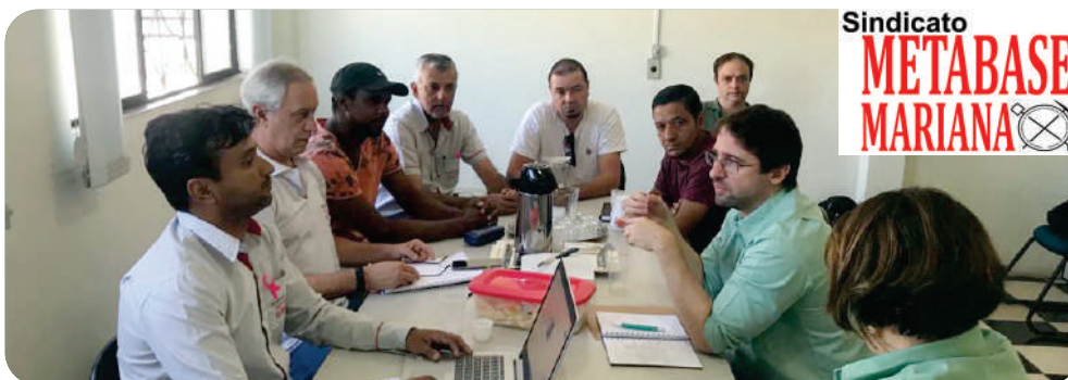
Sindicato METABASE MARIANA

Acompanhe o site do Metabase Mariana e fique por dentro! www.metabasemariana.com.br