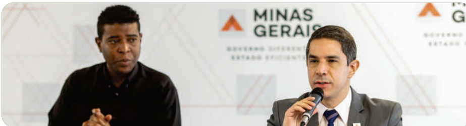
Pandemia de Covid-19, criado pela Lei 23.632, de 2020.

O FES é responsável por diversas ações ligadas ao Programa de Enfrentamento dos Efeitos da