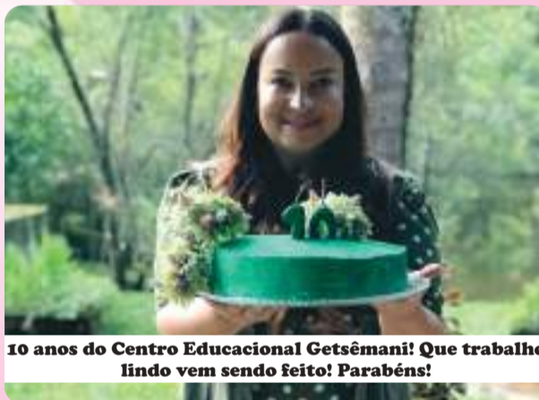
10 anos do Centro Educacional Getsêmani! Que trabalho lindo vem sendo feito! Parabéns!