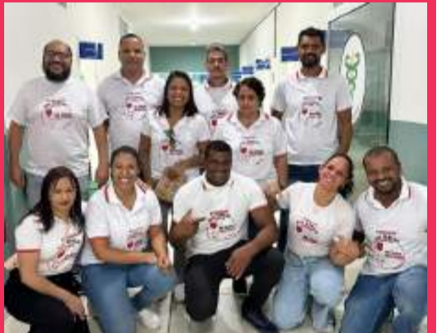
Doe Sangue, doe vida. Campanha realizada no último sábado, 25 de maio, da Associação Doe Sangue Mariana em parceria com a FUPAC Mariana e HemoMinas. O evento contou com cerca de 180 doadores. Parceria de sucesso!

@divasdarenda_lingerie / 31 989086346 / Parcelamos no cartão sem juros