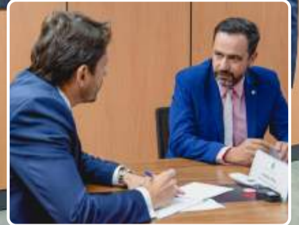
Deputado Federal, Duarte Jr. em reunião com o Ministro das Comunicações, Juscelino Filho, requerendo investimentos para fortalecer o sinal de telefonia móvel em Mariana e Ouro Preto. Ministro, garantiu que vai priorizar a região dos Inconfidentes após solicitação do Deputado. Duarte, pontuou também a interação entre os poderes legislativos de ambos os municípios para que juntos possam conduzir as ações necessárias para a implementação do sinal 5G.