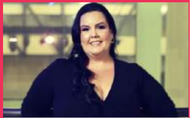
Arena Imobiliária CONFIRMADÍSSIMA no TROFÉU 2024!