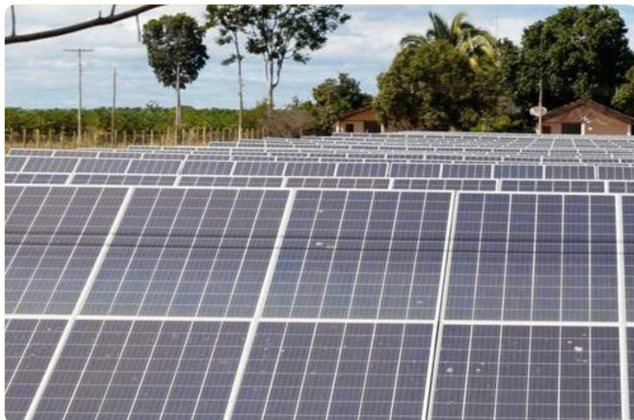
geração solar fotovoltaica.

Além disso, 100% dos 853 municípios de Minas Gerais possuem ao menos uma unidade de geração de energia solar fotovoltaica. Dos 834 empreendimentos em fase de construção ou com construção não iniciada em Minas Gerais que serão agregados à matriz energética do estado, 810 são de