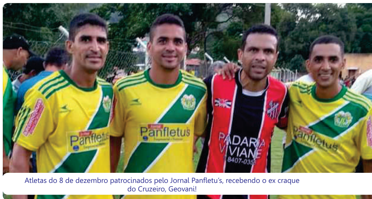
Atletas do 8 de dezembro patrocinados pelo Jornal Panfletu's, recebendo o ex craque do Cruzeiro, Geovani!