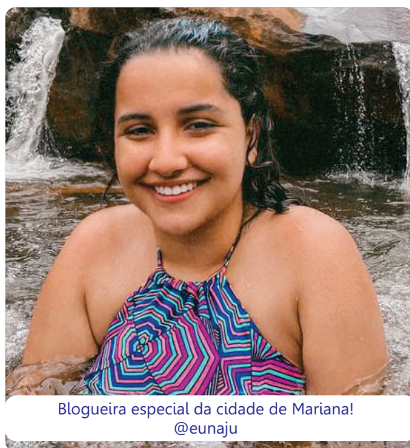
Blogueira especial da cidade de Mariana! @eunaju