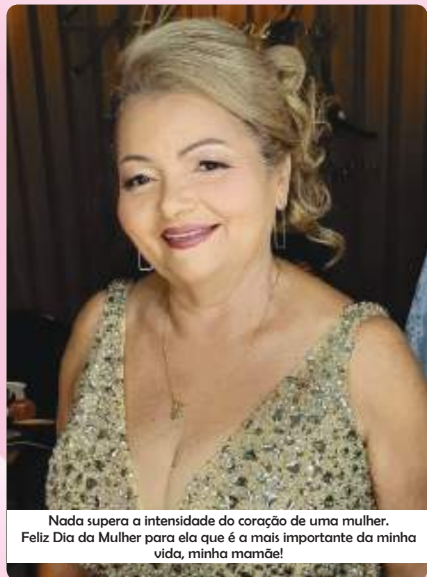
Nada supera a intensidade do coração de uma mulher. Feliz Dia da Mulher para ela que é a mais importante da minha vida, minha mamãe!