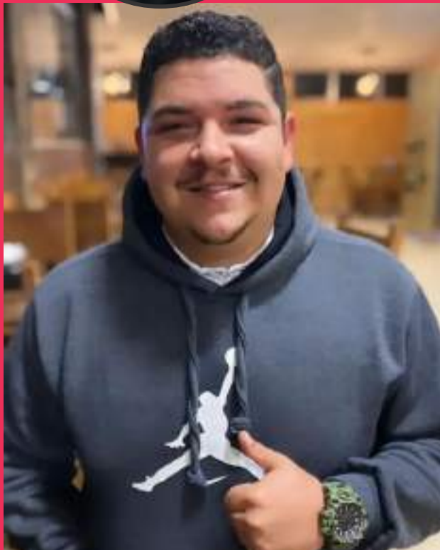
Dia 6 é aniversário do nosso amado Big! "Que o seu aniversário seja o início de um ano de luz, paz e prosperidade." TE AMAMOS!