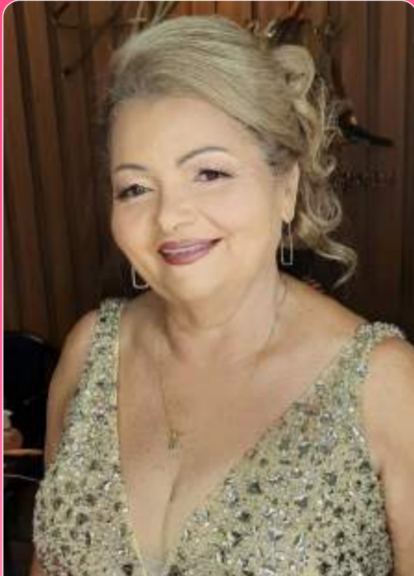
Dia 8 foi dia da mulher.. mais não me canso de falar que eu te amo e te admiro todos os dias! Minha Neroca!

Por aqui sempre aparece as notícias da semana, os aniversários, as homenagens, de tudo um pouquinho! Vem participar também - (31) 9 8632-8731