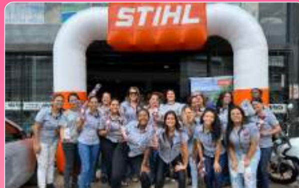
Dia da mulher comemorado com alegria na Empresa Murici! Elas merecem!