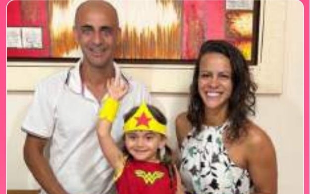
Viva os 3 aninhos da Iza! Os papais são apaixonados!