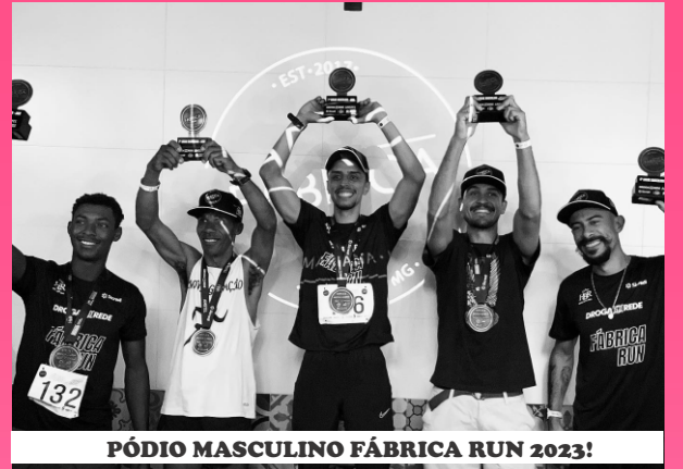
PÓDIO MASCULINO FÁBRICA RUN 2023!