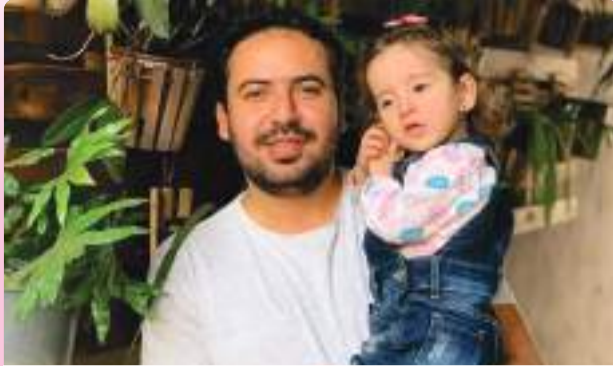
Viva nosso querido Diego! Muitas felicidades!