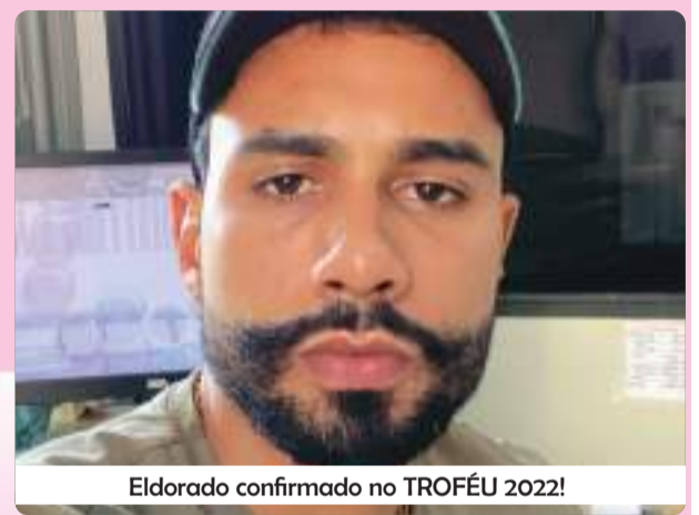
Eldorado confirmado no TROFÉU 2022!