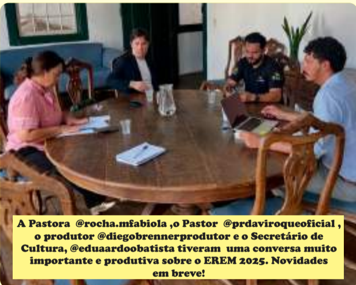
A Pastora @rocha.mfabiola ,o Pastor @prdaviroqueoficial , o produtor @diegobrennerprodutor e o Secretário de Cultura, @eduardoobata tiveram uma conversa muito importante e produtiva sobre o EREM 2025. Novidades em breve!