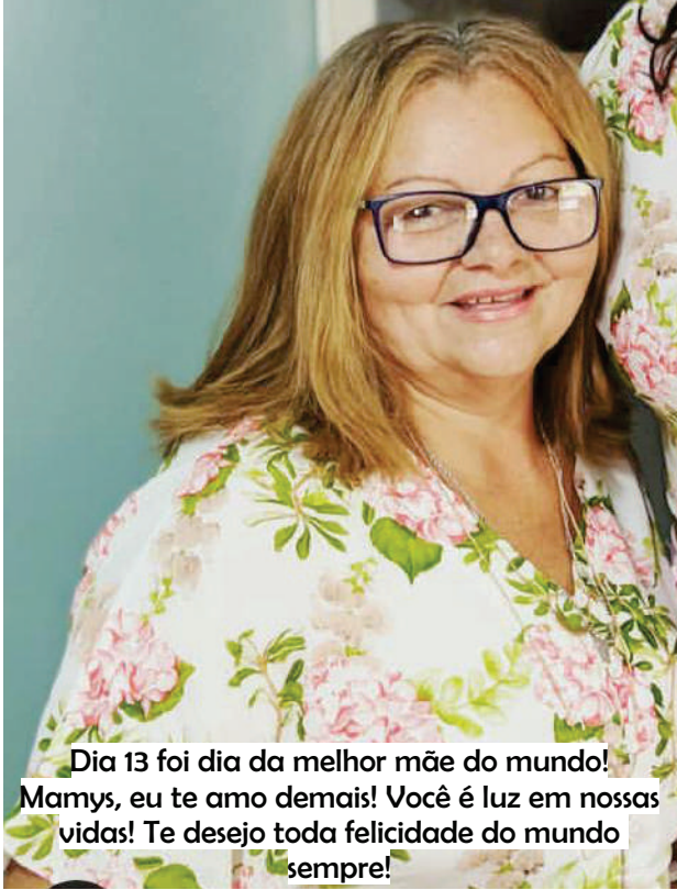
Dia 13 foi dia da melhor mãe do mundo! Mamys, eu te amo demais! Você é luz em nossas vidas! Te desejo toda felicidade do mundo sempre!