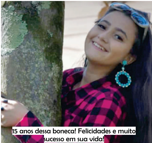
15 anos dessa boneca! Felicidades e muito sucesso em sua vida!