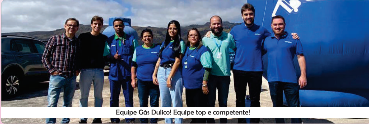
Equipe Gás Dulico! Equipe top e competente!