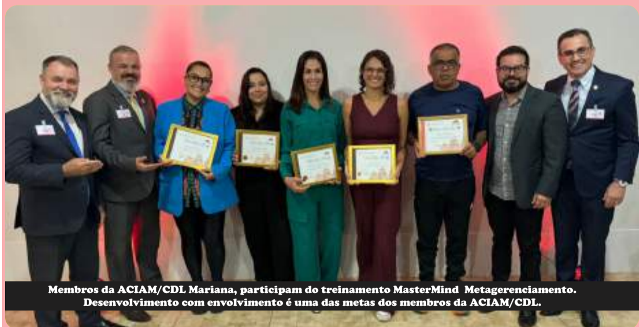
Membros da ACIAM/CDL Mariana, participam do treinamento MasterMind Metagerenciamento. Desenvolvimento com envolvimento é uma das metas dos membros da ACIAM/CDL.