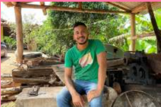
Wergan adora mostrar sua rotina nas redes sociais, e uma das coisas que ele ama é a natureza e passar o final de semana na roça, tem coisa melhor?