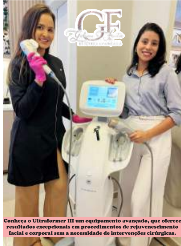
Conheça o Ultraformer III um equipamento avançado, que oferece resultados excepcionais em procedimentos de rejuvenescimento facial e corporal sem a necessidade de intervenções cirúrgicas.