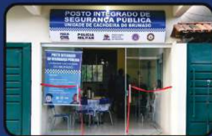
Posto Integrado de Segurança Pública Unidade de Cachoeira do Brumado

Inauguramos o Posto Integrado de Segurança Pública - Unidade Cachoeira do Brumado e Águas Claras.