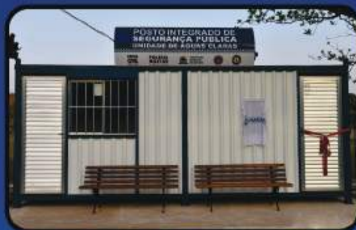
Posto Integrado de Segurança Pública Unidade de Águas Claras