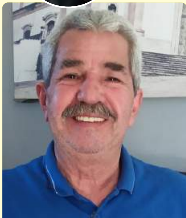
Dia 12 é dia do melhor pai do mundo todo! Homem íntegro, que alegra os dias da nossa família com sua risada contagiante! Te amamos papai, que venham mais 100 anos ao seu lado!

Por aqui agora vocês acompanham toda semana uma receita nova, horóscopo e muitas outras novidades!!!