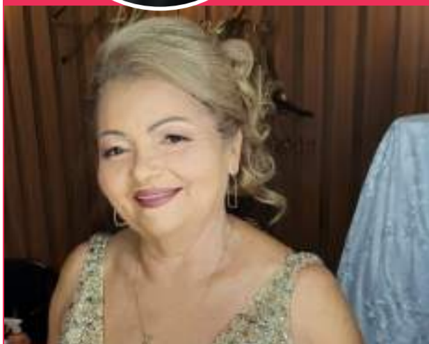
Hoje dia 13 é aniversário da minha rainha! Mulher íntegra! 69 anos de pura alegria e amor! Te amamos!

Por aqui sempre aparece as notícias da semana, os aniversários, as homenagens, de tudo um pouquinho! Vem participar também - (31) 9 8632-8731