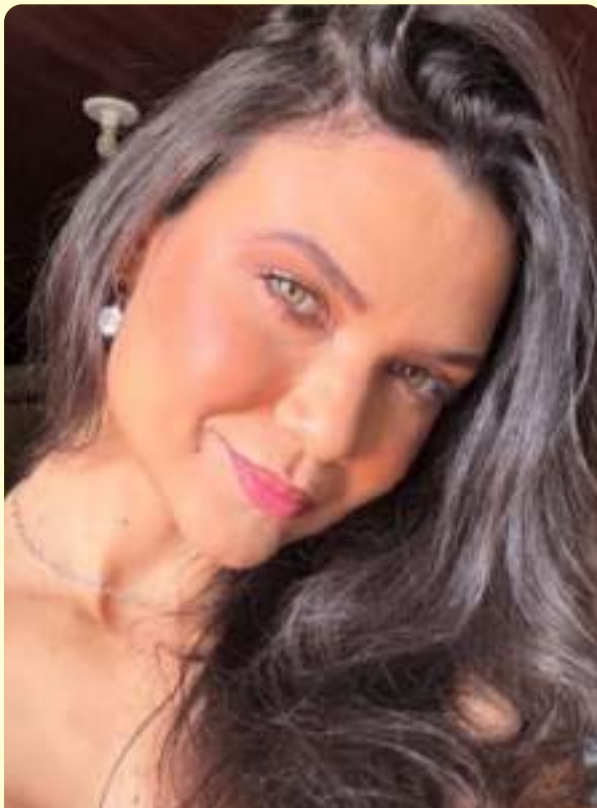
Esse ano mais uma vez a ONG IDDA receberá sua merecida homenagem no Troféu 2025! Um trabalho árduo, merece todos os aplausos!

26 Jul Sábado Odete gosta de César e pergunta a Marco Aurélio sobre o rapaz. Heleninha comenta com Celina que teve a impressão de que já conhecia o rosto de Olavo. Daniela aconselha André a não se relacionar com Aldeide. Celina fica sabendo que a empresa que fornece comida para as aeronaves da TCA faliu, e sugere a Raquel e Poliana que a Paladar assuma o posto. Lucimar promete a Vasco que pensará sobre a proposta de reatar com ele. Consuelo identifica o perfume de Aldeide em André. Maria de Fátima fica preocupada ao saber por Heleninha que um dos homens que roubou o quadro foi identificado pela empresa de segurança. Celina, Raquel e Poliana comemoram o negócio fechado com a empresa que fornecia comida para a TCA. Maria de Fátima avisa a César que a polícia chegará até Olavo.