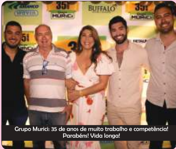
Grupo Murici: 35 de anos de muito trabalho e competência! Parabéns! Vida longa!