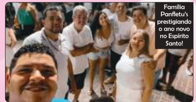
Família Panfletu's prestigiando o ano novo no Espírito Santo!