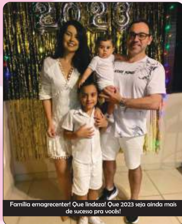
Família emagrecer! Que lindезa! Que 2023 seja ainda mais de sucesso pra vocês!