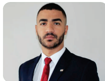
por Danilo Alves, Advogado especialista em Direito Previdenciário.

Mesmo que o segurado dê a entrada em seu pedido de aposentadoria após a entrada em vigor das novas regras, estes farão jus ao cálculo do benefício mais vantajoso. Contudo, aqueles que preencherem os requisitos