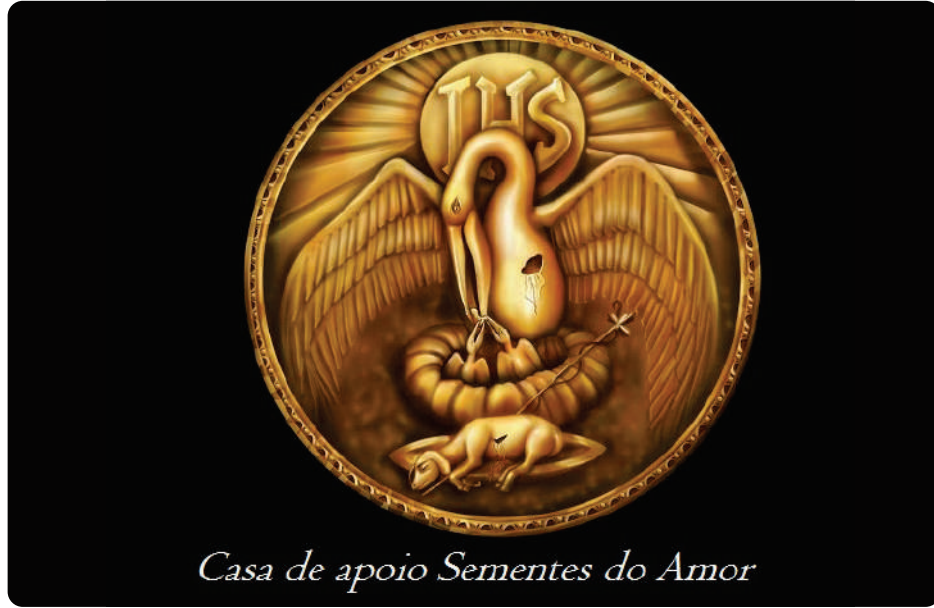
Casa de apoio Sementes do Amor

Além é claro, oferecer aos residentes e à sua família (quando tiver) um ambiente propício ao diálogo, à interação e ao convívio, a fim de possibilitar a reinserção no meio familiar e social. Desenvolver técnicas em processos grupais com residentes e seus familiares,