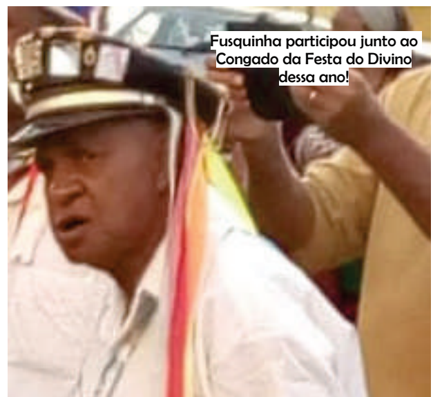
Fusquinha participou junto ao Congado da Festa do Divino dessa ano!