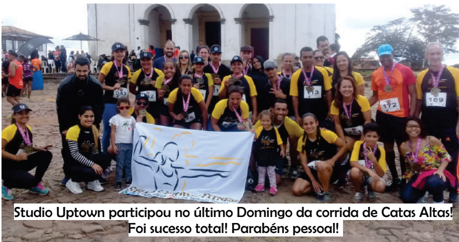
Studio Uptown participou no último Domingo da corrida de Catas Altas! Foi sucesso total! Parabéns pessoal!