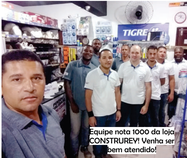
Equipe nota 1000 da loja CONSTRUREY! Venha ser bem atendido!