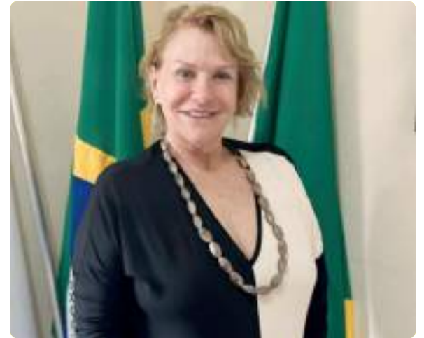
essencial para a segurança e bem-estar da população.