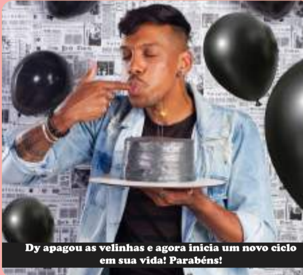
Dy apagou as velinhas e agora inicia um novo ciclo em sua vida! Parabéns!