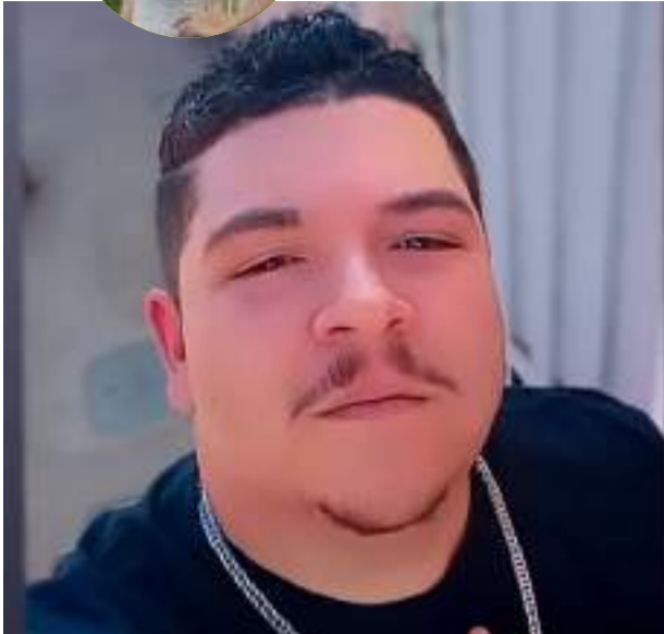
Ter você na minha vida é um presente que agradeço todos os dias. Que seu novo ciclo seja cheio de conquistas, saúde, felicidade e muitos sonhos realizados. Te amo demais, irmão!

Aniversários, viagens, casamentos, horóscopo... por aqui você fica sabendo de tudo que acontece em nossa Região!