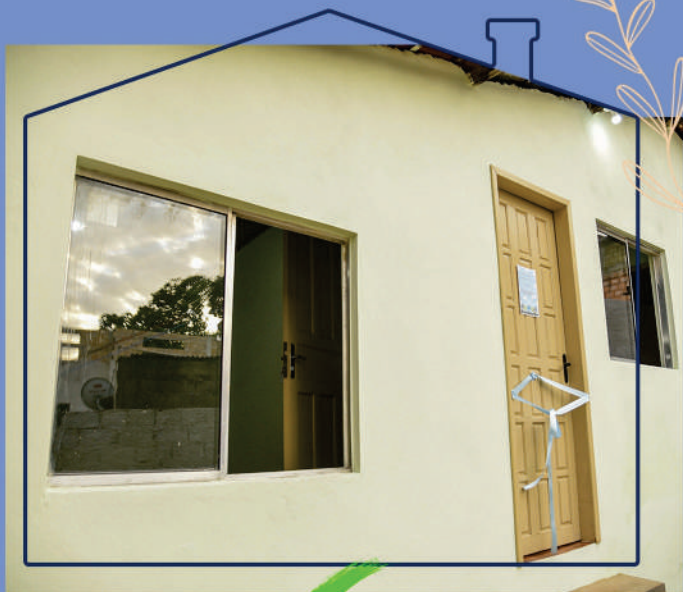
✓ São Cristóvão

O supermercado está entre os maiores da cidade, com 3200 m 2 de construção, 97 (noventa e sete) vagas para estacionamento e irá funcionar como atacarejo.