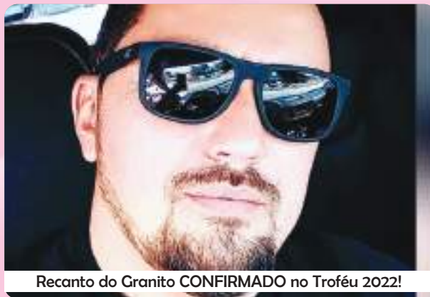
Recanto do Granito CONFIRMADO no Troféu 2022!