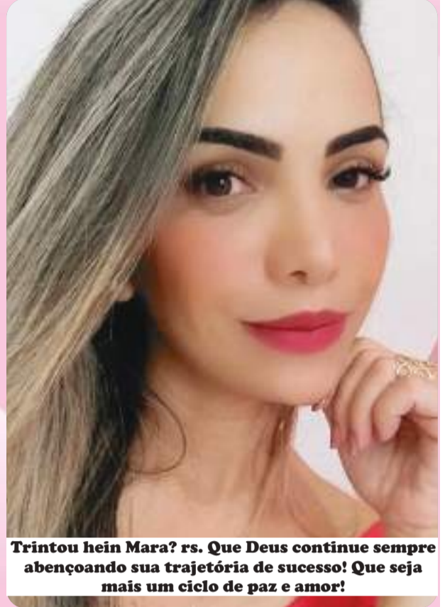
Trintou hein Mara? rs. Que Deus continue sempre abençoando sua trajetória de sucesso! Que seja mais um ciclo de paz e amor!