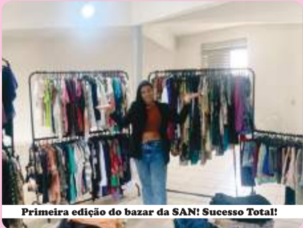
Primeira edição do bazar da SAN! Sucesso Total!