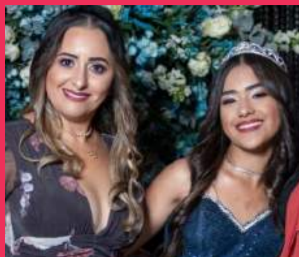
Design Planejados CONFIRMADO NO TROFÉU 2024!