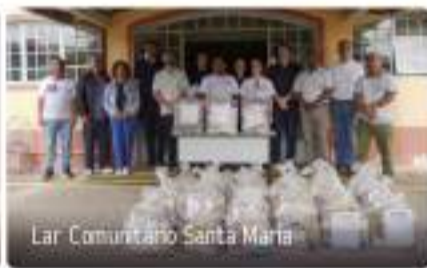
Lar Comunitário Santa Maria