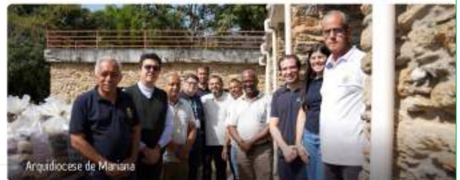
Arquidiocese de Mariana