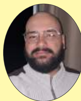
por Júnio Liberato

Afinal, quem lhe puxaria as orelhas e lhe abriria os olhos — ainda que por pura implicância ou maldade — mostrando que nem todos merecem estar no seu círculo mais íntimo? Atente-se: opinião nem sempre é para ser dita; intimidade é um caro e seletivo atributo. Utilize-a com sabedoria. São meus votos para 2026; não leve consigo babagens irrisórias: dopamina barata, companhias que atrasam e bajulações que aprisionem. São mais 12 meses para se fazer a diferença: em si, para si e ao próximo.