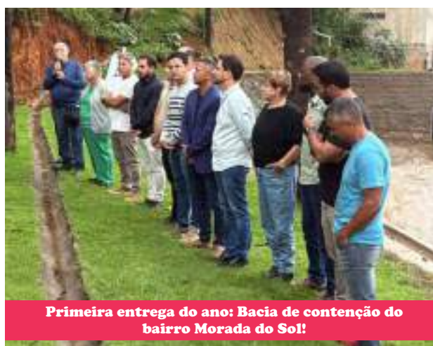
Primeira entrega do ano: Bacia de contenção do bairro Morada do Sol!