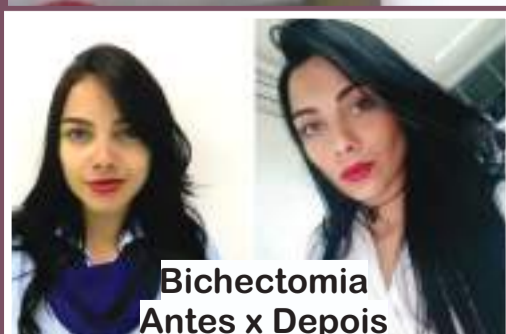
Bichetomia Antes x Depois

Atendemos todas as idades e temos condições especiais para o natal e final de ano. Venha nos visitar, agende agora mesmo sua avaliação.