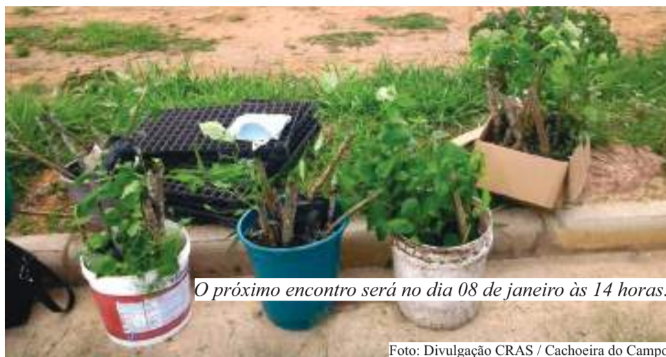
O próximo encontro será no dia 08 de janeiro às 14 horas.