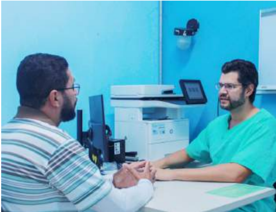
Exames e acesso pelo SUS

A especialista destaca que, embora a doença seja mais comum em pessoas acima dos 50 anos, tem sido observado um aumento de casos em faixas etárias mais jovens. Por isso, a recomendação é que o rastreamento seja iniciado, preferencialmente, entre 45 e 50 anos.