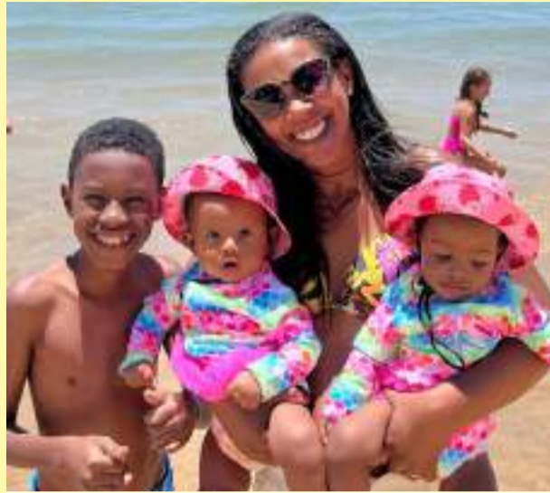
Exemplo de família unida e abençoada por Deus! Sonekinha Kids é um fenômeno na Região!